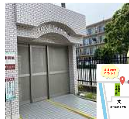
このマンションの 門を入れて突き当たり 101号室です!